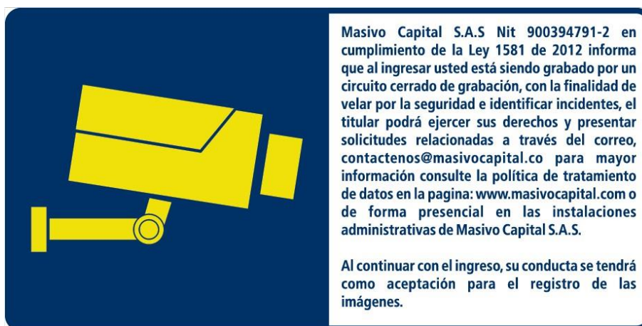
Señal de grabación dentro de los buses de Masivo Capital S.A.S.

Así mismo, la presente política está disponible para consulta ingresando a la página web de Masivo Capital: www.masivocapital.com